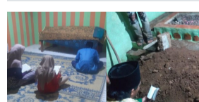
SUAMI ISTERI 2 jam yang lepas Yakin Anak Hidup Kembali, Suami Isteri Simpan Jenazah Anak Lebih 2 Bulan Di...