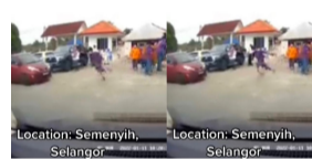
KINI TRENDING 2 jam yang lepas OKT Gagal Loloskan Diri, Hanya Sempat Lari 50 Meter Sahaja