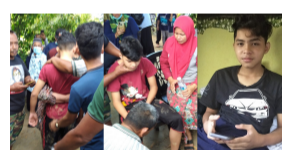
PASIR LINGGI 2 jam yang lepas Remaja Hilang Selepas 'Kencing' Dalam Semak Kini Ditemui - 'Handsome Sangat Kau...'