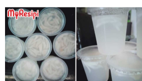
RESIPI Jan 12, 2022 @ 11:55am Senang Je Nak Buat Kelapa Jelly. Makan Waktu Cuaca Panas, Sejuk Tekak!