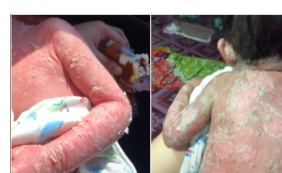
KINI TRENDING sejam yang lepas [VIDEO] Ibu Ini Kongsi Kisah Anak Hidap 'Psoriasis Pustular' Undang Sebak...