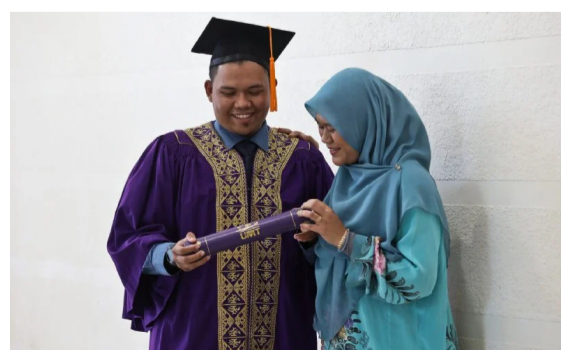
PENDIDIKAN Dis 10, 2021 @ 4:31pm Memandu e-hailing biayai