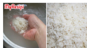
TIPS & PETUA 3 jam yang lepas Tukang Masak Dedah 'Rahsia Besar' Cara Masak Nasi Putih Sedap, Bukan Masak Begitu Saja