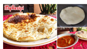
RESIPI Jan 12, 2022 @ 4:03pm Resipi Capati Gandum Mudah. Lepas Uli & Canai Terus Bakar, Tak Perlu Perap