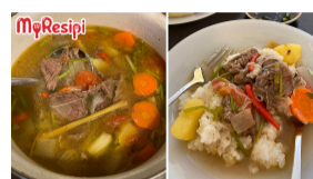
RESIPI 4 jam yang lepas Resipi Sup Daging Siam, Makan Dengan 'Moi' Aka Bubur Nasi Sangat Menyelerakan!