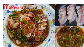
RESIPI Jan 12, 2022 @ 10:49am Resipi Sotong Masak Thai Sos Yang 'Marvellous', Pertama Kali Buat Pun Terus Menjadi