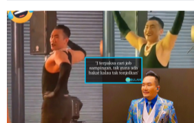
KINI TRENDING 2 jam yang lepas Viral Video Lelaki Lentik Menari Pakai Heels Mirip Dato' AC - 'I Tak Shave...'