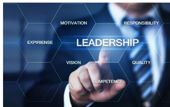
KOMENTAR Nov 22, 2021 @ 11:01am Kepemimpinan berkualiti resipi kejayaan organisasi