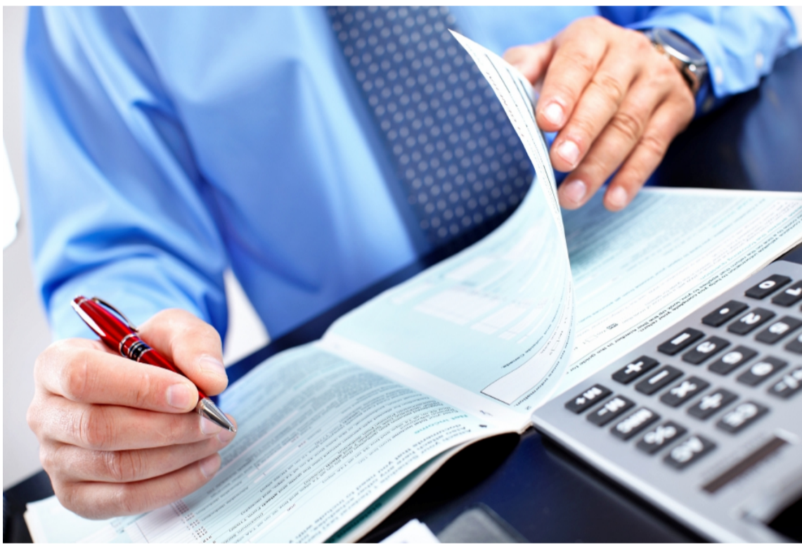
- Gambar hiasan

Kerjaya akauntan bukanlah satu-satunya pilihan yang ada selepas menamatkan pengajian dan jurusan perakaunan di menara gading. Namun, yang pasti bidang perakaunan menjanjikan masa depan yang cerah.