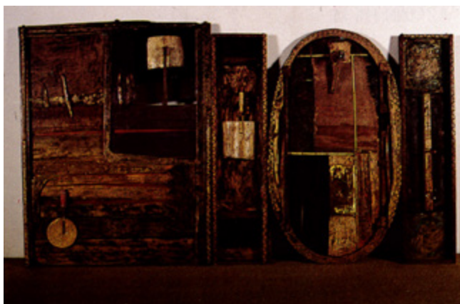
Plat 5 Azman Hilmi “Simbol Ekspresi Watak”, BMS 1992

Usai BMS 1991, panel penilai merasakan pendekatan bertema akan membataskan idea dan eksplorasi peserta BMS dalam berkarya. Melalui pendekatan bertema, ekspresi peserta terhad berdasarkan tema tertentu dan menyebabkan karya yang dipersembahkan tidak mencapai tahap yang diharapkan. Oleh itu, penstrukturan semula telah dibuat untuk BMS 1992. Pertandingan ini berbalik semula kepada landasan asal yang memberi ruang dan peluang kepada pengkarya muda menghasilkan karya eksplorasi baharu yang tidak terbatas. Perkara ini mendapat sambutan yang cukup luar biasa oleh pengkarya-pengkarya muda dengan penyertaan 223 orang pelukis dan 425 karya. Daripada jumlah tersebut, 199 karya daripada 66 peserta telah dipilih untuk dipamerkan dan Saudara Azman Hilmi muncul sebagai pemenang utama.