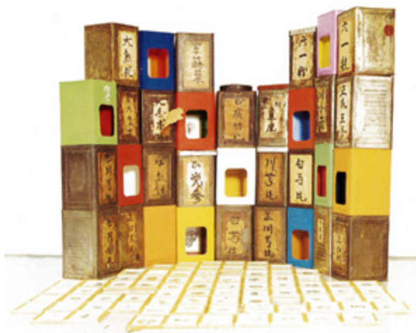
Plat 6 Susylawati Sualaiman “Kedai Obat Jenun”, BMS 1997

edisi kali ini. Oleh itu, jumlah wang hadiah telah dibahagikan sama rata dalam kalangan 11 peserta BMS (Shariff, 1994). BMS 1996 sekali lagi menyaksikan perubahan dari segi format. Perubahan format yang dianjurkan hasil daripada perbincangan panel pertandingan adalah (1) tidak adil untuk membandingkan karya dari pelbagai jenis media, olahan, skala dan objektif yang berlainan dalam satu kategori. (2) Perlunya para peserta untuk menghantar slaid pada penilaian pertama untuk dan hanya karya yang baik akan dipilih, seterusnya menjimatkan tenaga, ruang dan memudahkan pihak pengurusan. (3) Pertandingan hanya terbuka kepada peserta berumur antara 20-30 tahun supaya dapat menampilkan pengkarya yang matang dari sudut karyanya (Laporan Panel Hakim, 1996).