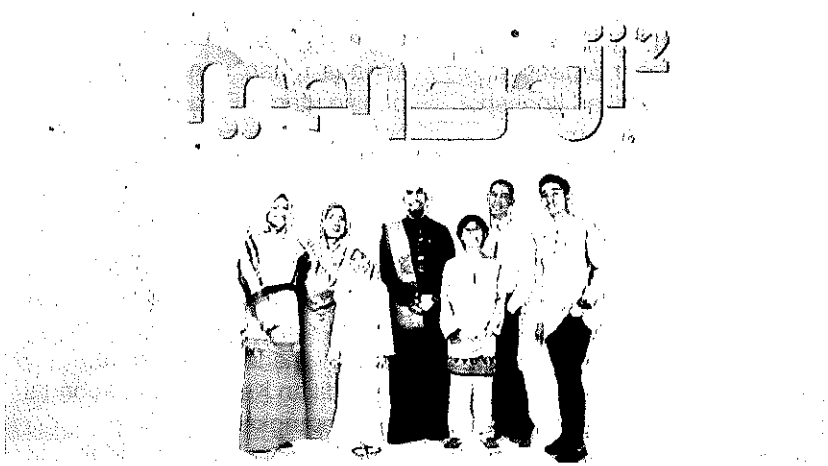
Pelbagai kaedah dan medium yang boleh digunakan untuk mengikuti kelas pengajian al-Quran.

Di Malaysia, pandemik bukan sahaja telah menjejaskan kesihatan awam secara serius, malahan turut memberikan impak yang besar terhadap kesejahteraan murid di sekolah, pelajar di institusi pengajian tinggi dan keluarga mereka dek kekangan aktiviti ekonomi dan sosial. Jika dilihat secara positif, kekangan pergerakan dan sosialisasi semasa era pandemik memberikan peluang yang besar untuk dimanfaatkan oleh para ibu bapa dalam proses pendidikan anak-anak khasnya menghubungkan dan mendekatkan mereka dengan al-Quran. Semasa pandemik, proses pendidikan berlaku di rumah secara optimum dan ibu bapa boleh membuat