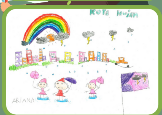
Lukisan Arina Alisya, 7 tahun, yang menggambarkan kegembiraan melalui warna yang ceria, pelangi dan ekspresi wajah figura yang tersenyum bermain di dalam hujan.