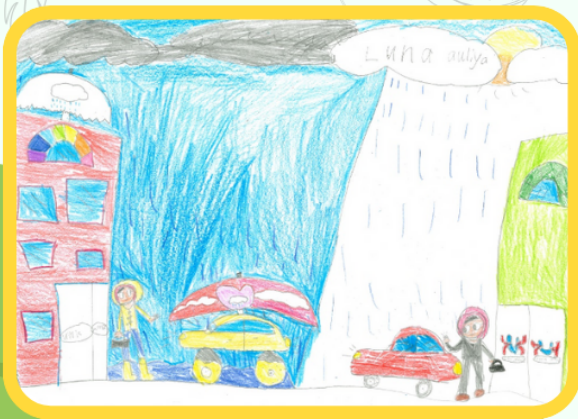
Lukisan Luna Auliya, 9 tahun, merakamkan suasana yang terkait dengan pengalaman peribadi (ibu menaiki kenderaan ke tempat kerja dalam cuaca hujan).

Apa yang benar-benar menonjol dalam lukisan-lukisan ini adalah kepelbagaian perspektif yang diapit dalam setiap lorekan pensil dan warna. Seseorang kanak-kanak merakamkan vitaliti tarian alam semula jadi, sementara yang lain menyelami kesunyian introvert yang sering dibawa hujan, menunjukkan pemahaman yang berbeza dalam pemandangan musim.