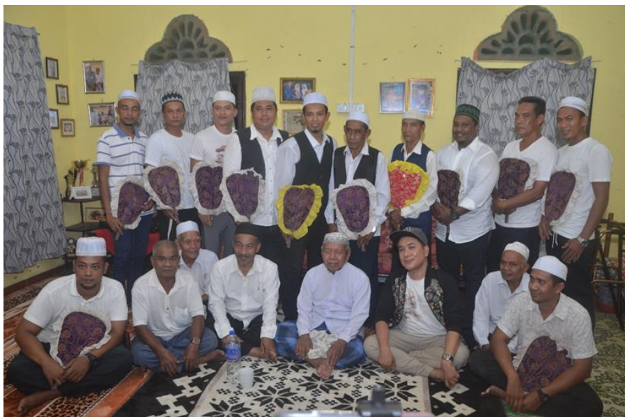
Rajah 1 : Kumpulan Dikir Laba Kampung Periok Tumpat Kelantan