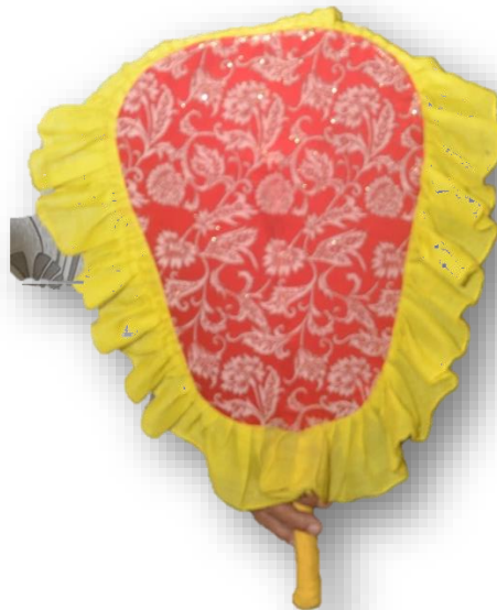
Rajah 6 : Kipas Kumpulan Dikir Laba Kampung Periok Tumpat Kelantan

Bahkan semasa pertandingan juga kipas ini mampu memainkan peranan untuk menutup kelemahan atau suara Jerit Musang yang terputus. Kipas yang dipegang oleh awok-awok akan memerhatikan nada dan bersedia untuk menepuk kipas sekuat-kuatnya apabila mendapati suara jerit Musang terputus semasa bernyanyi. Ia bertujuan untuk mengaburi pendengaran juri persembahan. Bukan sahaja mengawal nada suara malah membantu menaikkan semangat ahli kumpulan yang lain.