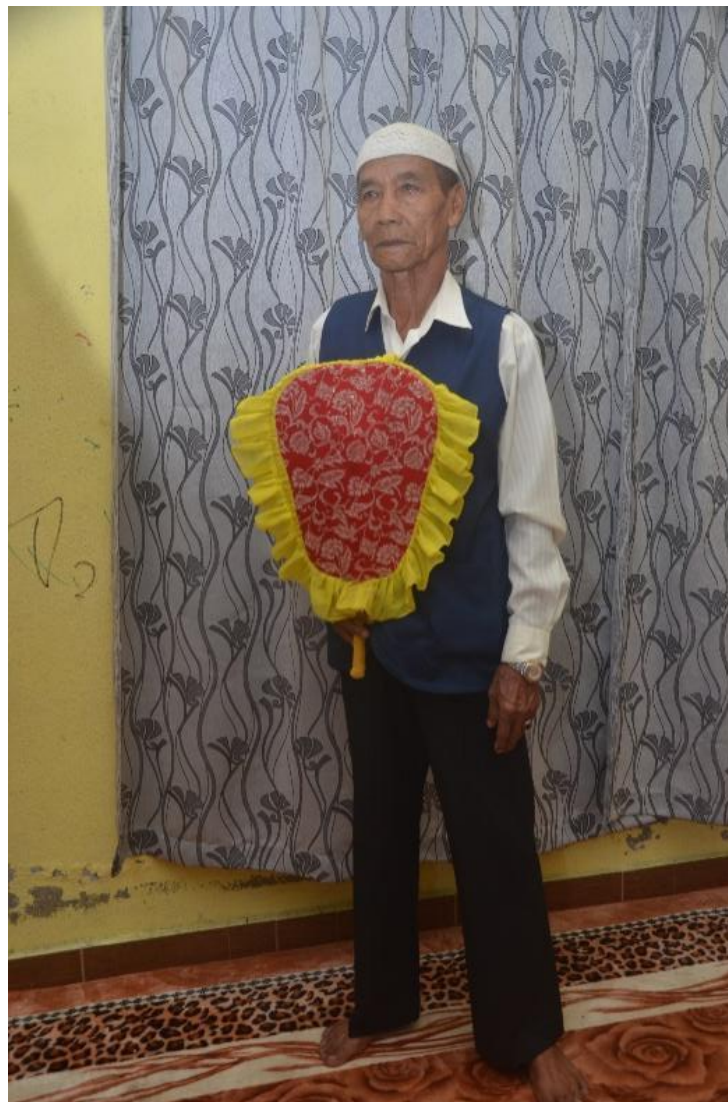
Rajah 5 : Pakaian Kumpulan Dikir Laba Kampung Periok Tumpat Kelantan

Oleh kerana kemunculan dan pembentukan Kesenian Dikir Laba adalah bermula dari kampung-kampung di sekitar negeri Kelantan, maka soal keseragaman berpakaian tidak dititikberatkan. Walau bagaimanapun mengikut keterangan dari sumber-sumber yang dapat dipercayai, terdapat sesetengah kumpulan yang menyeragamkan cara pemakaian ahli-ahlinya. Di mana pada asalnya mereka hanya memakai baju putih tengkuk bulat, tanjak dan seluar panjang. Namun demikian, sejak kebelakangan ini setengah Kumpulan Dikir Laba telah mempelbagaikan pakaian ahli-ahli kumpulan dengan pakaian yang berwarna-warni, memakai tanjak dan seluar hitam.