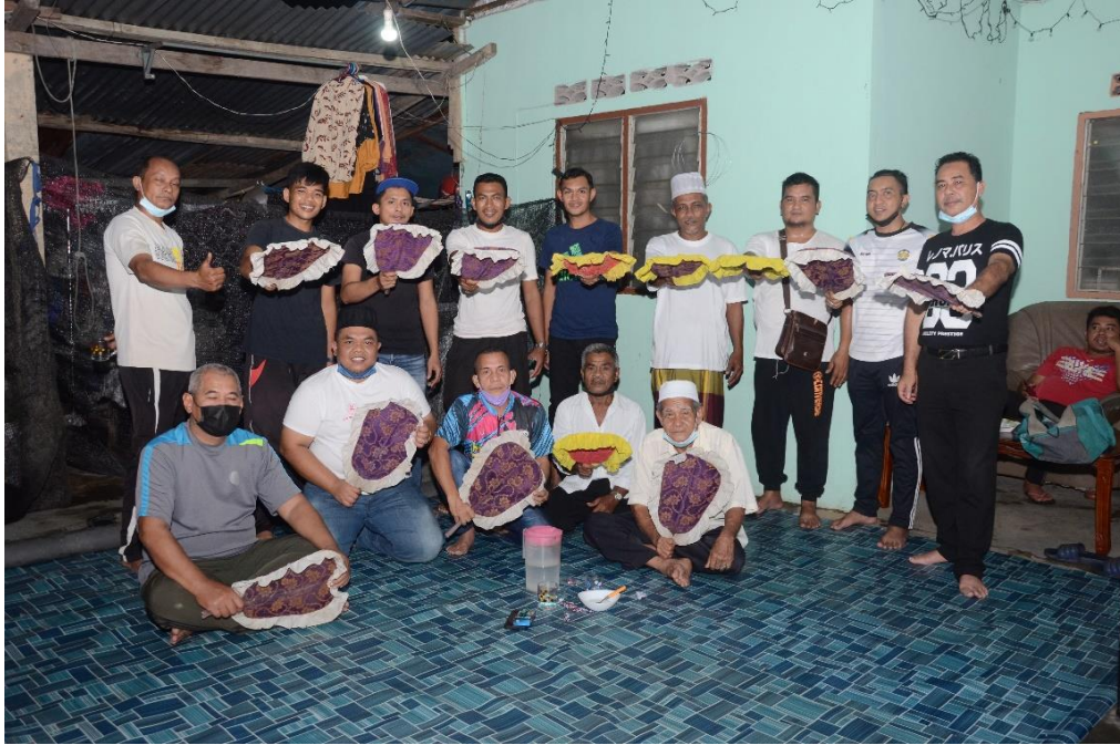
Rajah 2 : Kumpulan Dikir Laba Kampung Morak Tumpat Kelantan